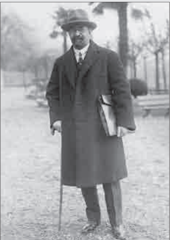
میرزا اسدالله خان

ادب بلکه در اخلاق علمی، کوشش، نوآوری و استفاده از امکانات سران سیاسی کشور برای تشکیل