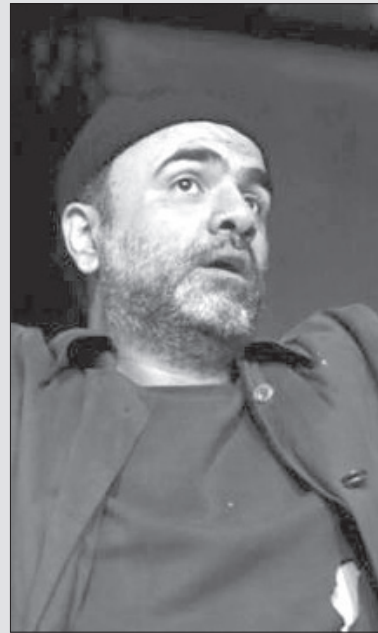
صمد رحیمی متولد سال ۱۳۵۵، کارگردان، نویسنده، بازیگر

اهل گرگان می باشد به بهانه ی اجرای تئاتری باعنوان "روایهای آبی مردان صلیب سرخ" بالیشان به گفت و گو نشستیم.