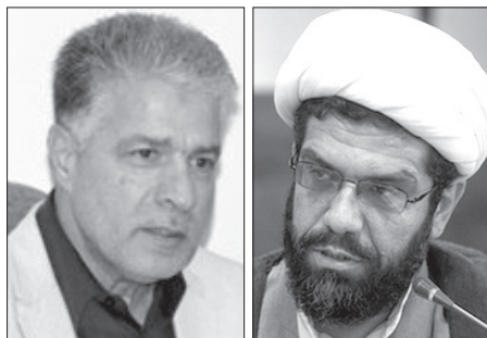
نقد و بررسی اندیشه های سیاسی