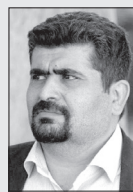
■ شبیر دائمی