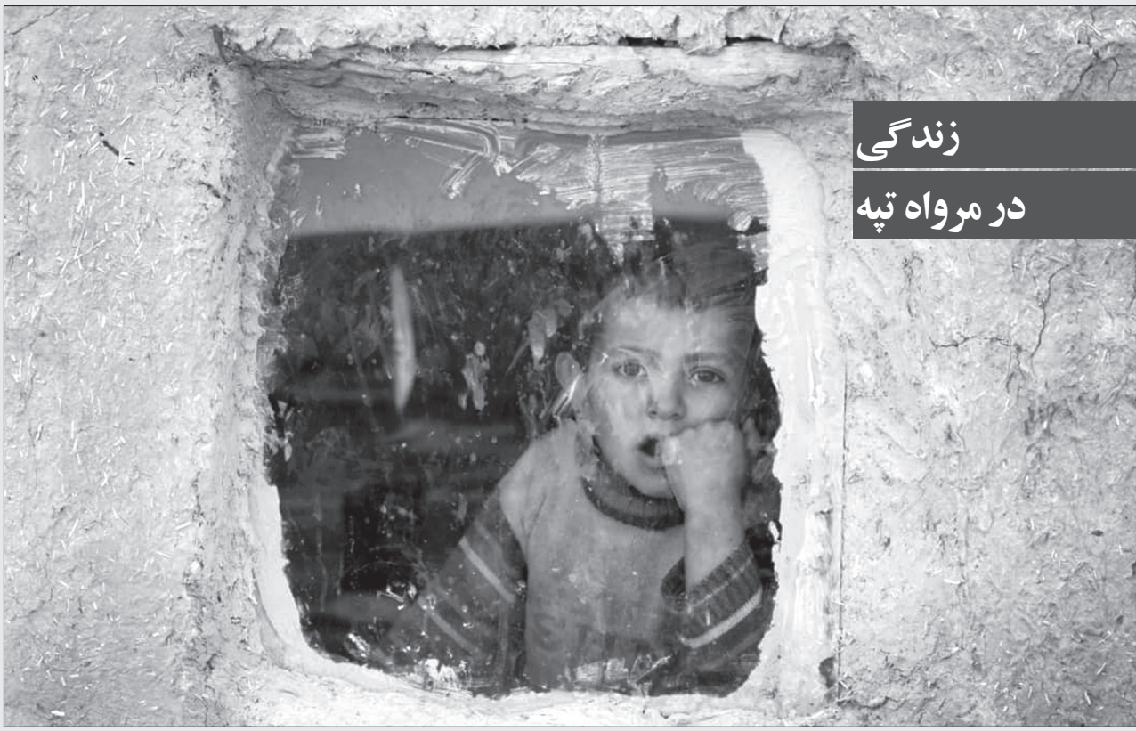
زندگی در مرواه تپه

کرد: افزایش سطح مواد آلی در داخل خلیج گرگان موجب رشد برخی گیاهان و جلبک ها در خلیج شد. با توجه به اینکه جلبک ها اکسیژن داخل آب را مصرف می کنند، باعث رشد برخی باکتری های بی هوازی عامل بیماری بوتولیسم شدند. مدیرکل دامپزشکی گلستان بیان کرد: با توجه به اینکه سطح آب خلیج گرگان افزایش پیدا نکرده، این احتمال را می دهیم که امسال هم رخداد مرگومیر غیرطبیعی پرنندگان وحشی مهاجر را در خلیج گرگان داشته باشیم. به گزارش ایسنا، زمستان سال گذشته بیش از ۴۳ هزار پرنده مهاجر آبی در محدوده تالاب میانکاله و خلیج گرگان در دو استان مازندران و گلستان تلف شدند.