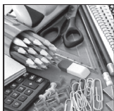
وقتی لوازم التحریر به عاملی برای رقابت تبدیل می شود