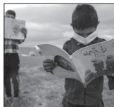
سه هزار دانش آموز گنبدی تحت حمایت کمیته امداد هستند