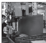
واحدهای تولیدی تگران قطعی گاز در زمستان هستند