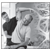
کشف تازه‌ای که استخوان‌ها را دوباره زنده می‌کند