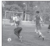
احیای پروژه‌های راکد و ساخت ۶ زمین چمن مصنوعی